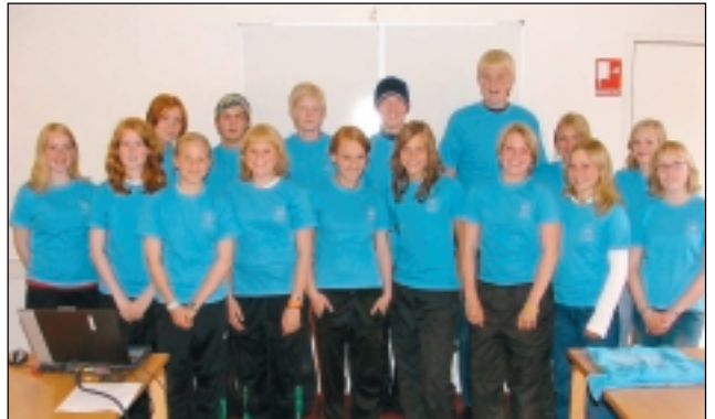
Nemendur Vinnuskólans á Húsavík kunnu vel að meta fræðslu um verkalýðsmál, atvinnumál og önnur velferðarmál á svæðinu.

Unglingar úr Vinnuskólanum á Húsavík komu í heimsókn á skrifstofu stéttarfélaganna á Húsavík ásamt flokksstjórum á síðasta degi skólans í haust. Markmið heimsóknarinnar var að fræðast um starfsemi félagsins, atvinnulíf á Húsavík og helstu mál er varða velferð íbúa á svæðinu. Þau lögðu fram fjölmargar