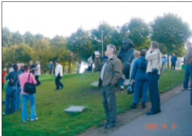
Þingeyingar skoða sig um í Tallin.

og voru ferðalangarnir ánægðir með dvölinu í Tallin og skoðunarferðir út um sveitir Eistlands. Á myndinni hér fyrir neðan má sjá nokkra fróðleikspyrsta félagsmenn skoða sig um í Eistlandi.