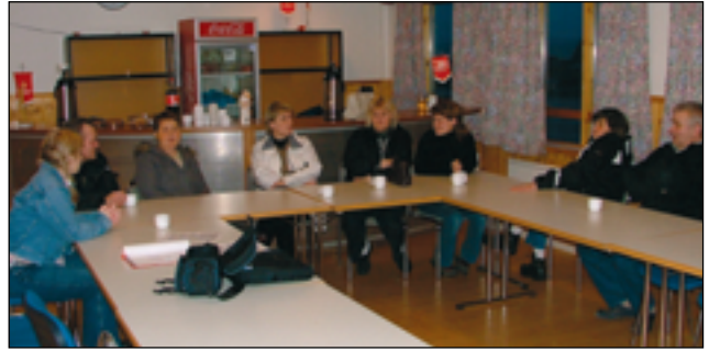
Stéttarfélagin í Þingeyjarsýslum bafa undanfarið fundað með starfsmönnum sveitarfélaga vegna mótunar kröfugerðar þar sem samningar eru lausir eftir áramót og þá befur nýja starfsmatið einnig verið til umræðu. Á myndinni eru starfsmenn Þórs hafnarbrepps að ræða um starfsmatið og komandi kröfugerð.

Hafa ber í huga að framangreindir styrkir eru miðaðir við starfsmenn í fullu starfi og flestir þeirra greiðast í hlutfalli við starfshlutfall félagsmanns. Þeir sem hættir eru störfum og t.d. komnir á eftirlaun eiga einnig rétt á þeim styrkjum sem eru ekki beint tengdir þátttöku á vinnumarkaði, s.s. vegna sjúkranudds og sjúkrabjálfunar.