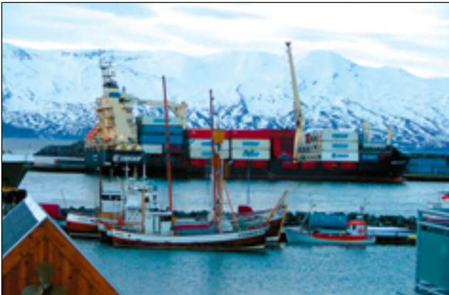
Mánafoss við bryggju á Húsavík í síðustu bringferð sinni um landið á sama tíma og Kísiliðjuni við Mývatn var lokað.