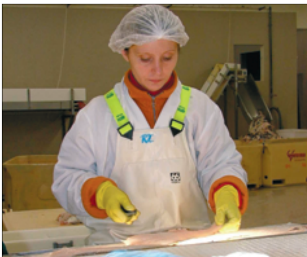
Þessi mynd er tekin hjá GPG-Fiskverkun á Rauðarhöfn en þar hefur mikið verið að gera undanfarið.