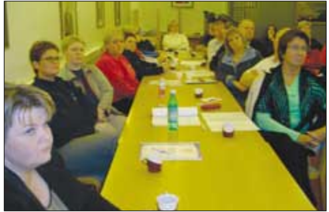
Hluti þátttakenda á námskeiðinu.

Í byrjun október hélt Verslunarmannafélag Húsavíkur tvö námskeið, í samvinnu við Securitas, lögregluna á Húsavík og verslanir, um öryggismál í verslunum.