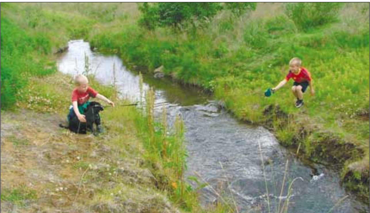
Veðrið þefur leikið við okkur Þingeyinga í sumar og oft þefur verið tilefni til að fækka fötum og bregða á leik. Hér má sjá tvo unga Húsvíkinga með hund leika sér við Skógargerðislekinn.