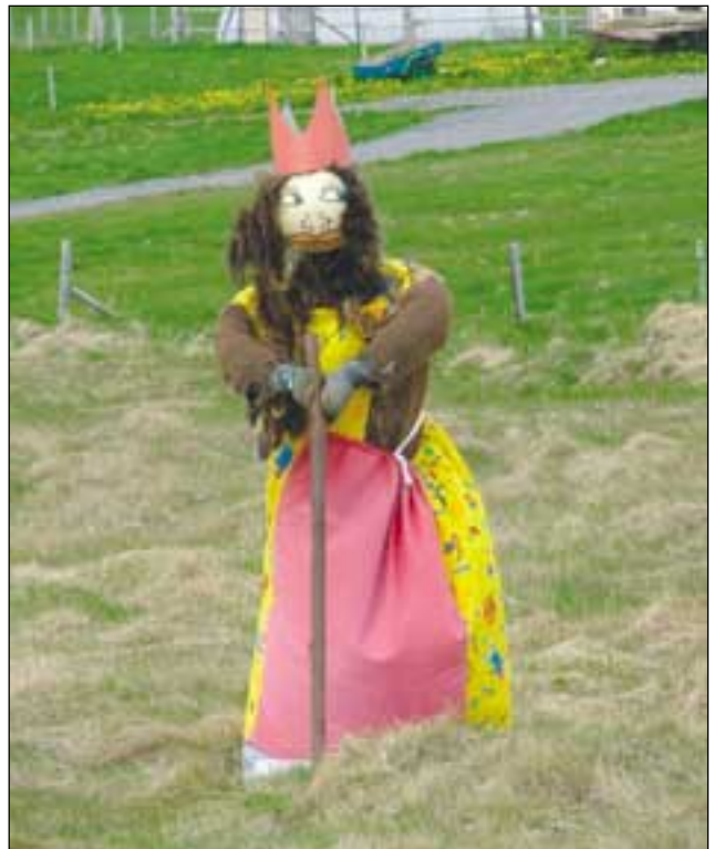
Fréttabréf stéttarfélaganna befur ákveðið að tilnefna þessa fuglabræðu sem stendur við Kópasker sem drottningu íslenskra fuglabræða. Þar með hafa Þingeyingar eignast tvær drottningar, það er Herðubreið sem er drottning íslenskra fjalla og nú drottningu íslenskra fuglabræða. Hér með er auglýst eftir fleiri drottningum.