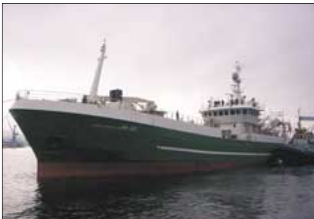
Björg Jónsdóttir PH-321 er væntanleg til heimabafnar á Húsavík síðar í þessum mánuði. Nýja skipið er allt bið glæsilegasta enda búið að gera á því miklar breytingar. Skipið var keypt frá Noregi og befur undanfarið verið í slipp í Póllandi þar sem gerðar bafa verið á því verulegar breytingar.

■ Samningurinn gildir frá undirskriftardegi til 31. maí 2008.