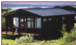
Eiðar á Héraði 3 svefnherb.

• Orlofsbyggðinni Eiðum á Héraði, rétt norðan Egilsstaða. Sumarhús með þremur svefnherbergjum og aðgangi að báti á Eiðavatni.