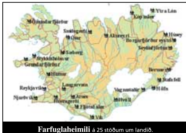
Farfuglaheimili á 25 stöðum um landið.

með gasi og tjaldvögnunum fylgir gashella, gashitari, stólar og borð.