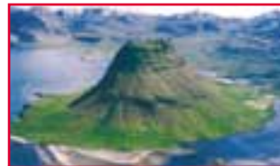
Hálsabóli v/Grundarfj. 2 svefnherb. + svefnsofi í stofu

• Orlofsbyggðinni Munaðarnesi Borgarfirði. Tvö sumarhús með þremur svefnherbergjum með heitum potti. Í orlofsbyggðinni er góð aðstaða, s.s. leiktæki fyrir börn og þjónustumiðstöð.