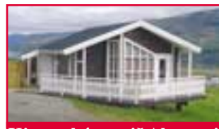
Kjarnaskógur við Akureyri 3 svefnherb.

• Alviðru í Dýrafirði. Eldra íbúðarhús með tveimur svefnherbergjum.