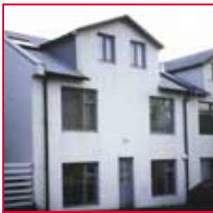
Freyjugata 10 Reykjav.

• Orlofsbyggðinni Ölfusborgum við Hveragerði. Sumarhúsið er með þremur svefnherbergjum og heitum potti.