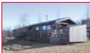
Flúðasel á Flúðum 3 svefnherb. / Heitur pottur

• Klifabotni í Lóni, rétt austan Hafnar í Hornafirði. Sumarhús með þremur svefnherbergjum.