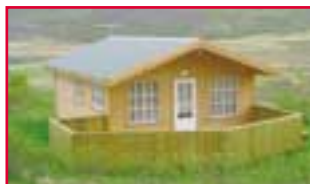
Illugastaðir Fnjóskadal 2 svefnherb. og svefnsofi

Í sumar er boðið upp á sumarhús og íbúðir á eftirtöldum stöðum: