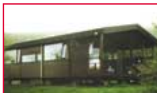
Einarsstaðir Héraði 3 svefnherb.

• Orlofsbyggðinni Illugastöðum Fnjóskadal, nýtt orlofshús með tveimur svefnherbergjum. Illugastaðir eru vel í sveit settir í nágrenni Húsavíkur. Í byggðinni er góð aðstaða fyrir börn og sundlaug. (Ekki í boði 18/6-13/8 vegna leiguskipta)