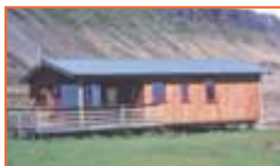
Klifabotni í Lóni 3 svefnh.

• Orlofsbyggðinni Eiðum á Héraði, rétt norðan Egilsstaða. Sumarhús með þremur svefnherbergjum og aðgangi að báti á Eiðavatni.