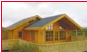
Útgarður Grímsnesi 2 svefnherb. + svefnsofi / H.pott.

• Mörk Grímsnesi, við Álfvatn. Sumarhús með þremur svefnherbergjum og heitum potti.