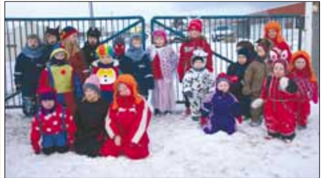
Á öskudaginn mættu að venju binar ýmsu persónur á leikskólann á Þórsböfn, þar ber belst að nefna Linu langsókk, prinsessur, bangsa, kanínur, lögregluþjóna og Batman. Var svo baldið af stað í fyrirtæki bæjarins og sungið af hjartans list í skeiptum fyrir góðgæti.