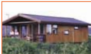
Mörk Grímsnesi 3 svefnherb. / Heitur pottur

• Flúðasel, við Flúði. Sumarhús með þremur herbergjum og heitum potti.