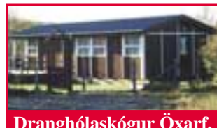
Dranghólaskógur Öxarf. 3 svefnherb.

• Kjarnaskógi við Akureyri. Sumarhús með þremur svefnherbergjum og heitum potti (Ekki í boði 27/6-1/8 vegna leiguskipta).