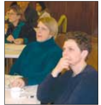
Kjaramál til umræðu hjá VÖ.

Í þessari viku eru fyrirhugaðir fundir um kjaramál með félagsmönnum Verkalýðsfélags Öxarfjarðar. Til stendur að ganga frá sérsamningum við Rifós, Silfurstjórnuna og Fjallalamb. Þá stendur jafnframt til að halda félagsfund um kjarasamning Starfsgreinasambands Íslands og Samtaka atvinnulífsins. Sá fundur verður auglýstur síðar sem og atkvæðagreiðsla sem fram fer um sérsamninga félagsins og nýgerðan kjarasamning Samtaka atvinnulífsins og Starfsgreinasambands Íslands.