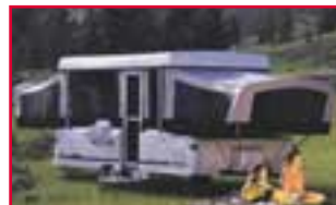
Fellihýsi Svefnstæði fyrir 6 Gashellur / Gas-/rafmíðstöð

Fellihýsin og tjaldvagnarnir eru allir nýir eða nýlegir. Þeir eru leigðir